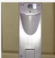
Lave-mains avec pompe à main avec grand réservoir Capacité : 45 L