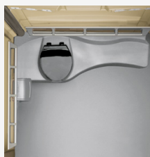
Grand réservoir Capacité : 257 L